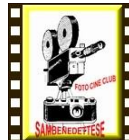
FOTO CINE CLUB SAMBENEDETTESSE

Realizziamo un grande reportage sulla nostra città sulla nostra gente sulle nostre attività con immagini inedite e originali