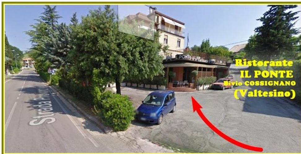
Ristorante IL PONTE Bivio COSSIGNANO (Valtesino)

Val Tesino – Ponte Tesino Bivio COSSIGNANO 16 km da Grottoammare